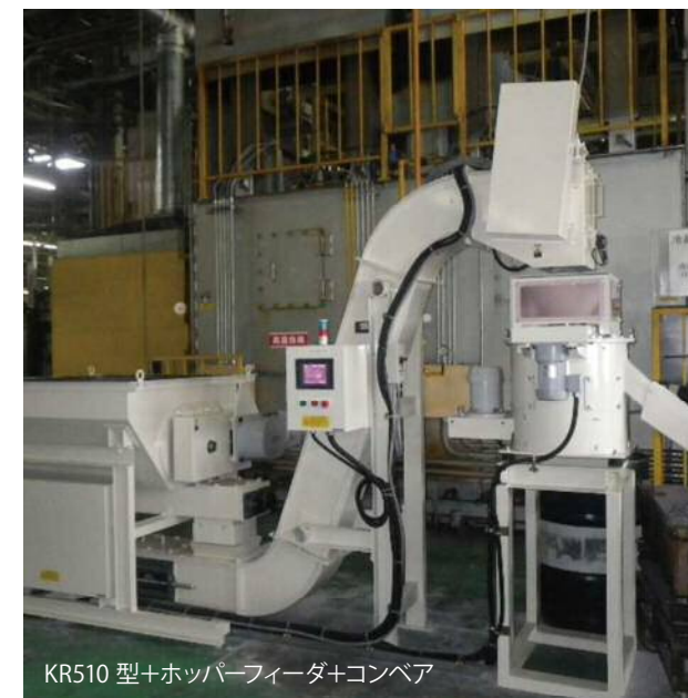
KR510 型+ホッパーフィーダ+コンベア