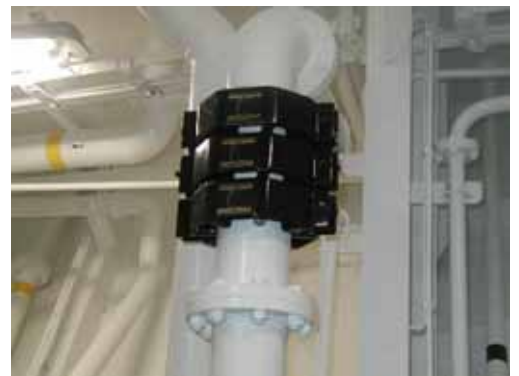
「マグ馬力」 型式：A45 × 3個