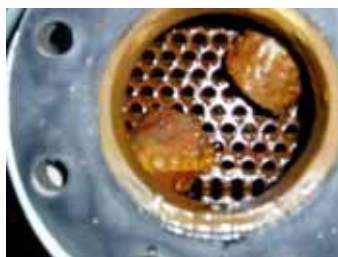
「マグ馬力」設置後 潤滑油クーラ入口